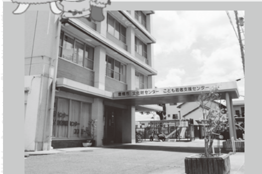
会場の豊橋市文化財センター (建物2階)