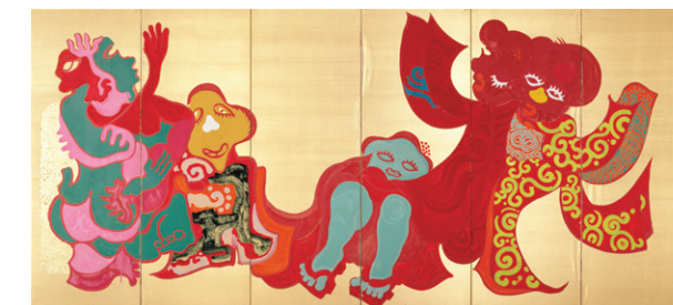
中村正義《おねえちゃん》(右隻) 愛知県美術館蔵 ※前期展示

観覧料●一般・大学生 1,200(1,000)円 小・中・高生 600(500)円