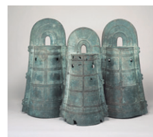
伊奈銅鐸 東京国立博物館蔵