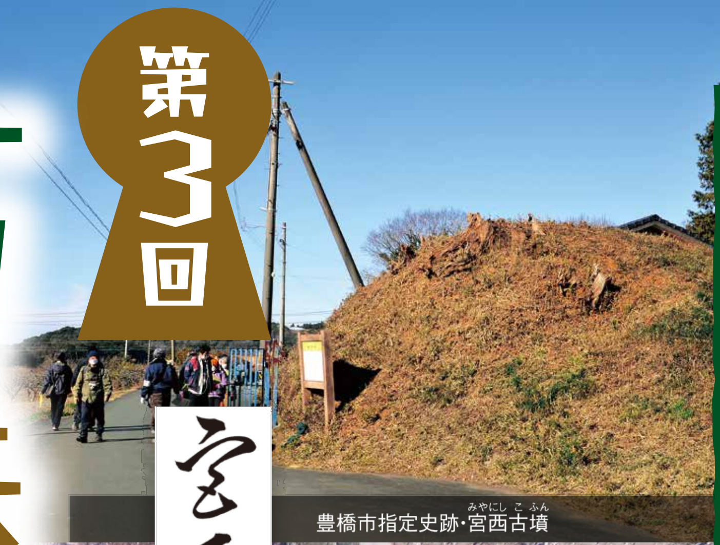
豊橋市指定史跡・宮西古墳