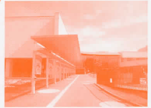
どちらも会場はココニコ!