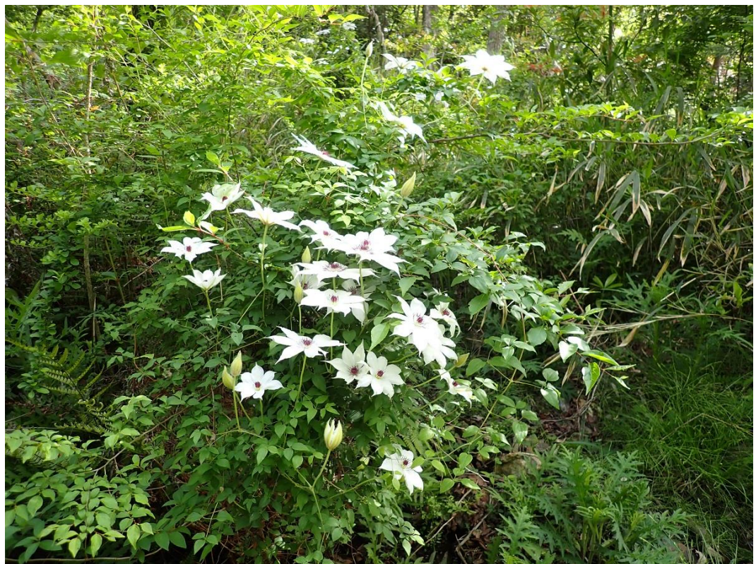
L地点のカザグルマ（2021年4月27日）

L地点の四の沢沿いでは、161輪が確認できました。間伐して明るい森にしたところでは開花数は2020年に若干減りましたが順調に増えています。カザグルマは、L地点では明るい森内に点々と広がっていますが、J地点は一か所に集中しています。L地点では発芽数は多いのですが、開花