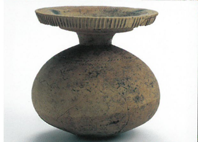
境松遺跡出土の加飾壺