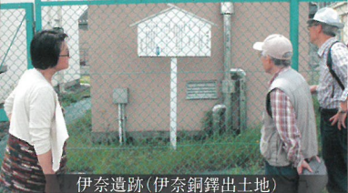
伊奈遺跡(伊奈銅鐸出土地)