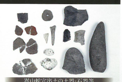
高山蛇穴出土の土器・石器等