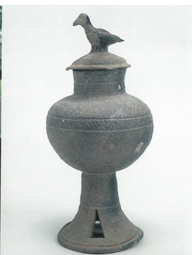
萬福寺古墳出土の鳥鈕蓋付脚付壺