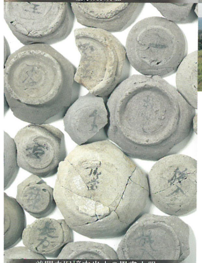
普門寺旧境内出土の黒書土器