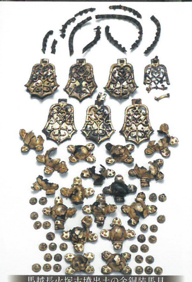
馬越長火塚古墳出土の金銅装馬具