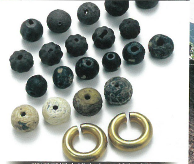
磯辺王塚古墳出土の玉類・耳環