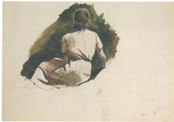
《クリスティーナの世界》習作 1948年