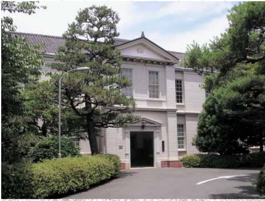
第15師団司令部庁舎(町細町・現愛知大学記念館・国登録文化財)