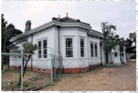
第15師団長官舎(高師石塚町・愛知大学公館・市指定文化財)