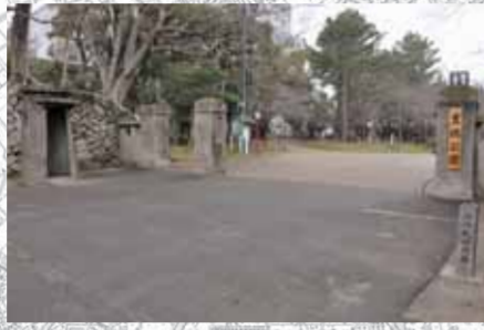
第18聯隊正門と哨舎(今橋町・豊橋公園)