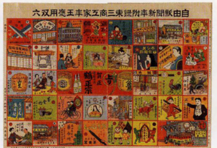
東三商家年玉応用双六/大正15年/佐清力氏蔵