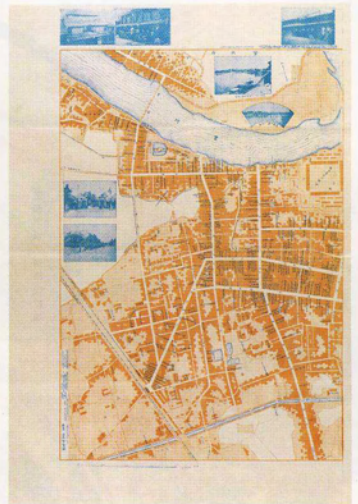
東参之商工業一覽略図 豊橋市西半部/明治41年 当館蔵(佐清力氏寄贈)