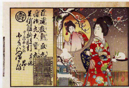
引札/明治35年/当館蔵(後藤謙治郎氏寄贈)

440-0801 愛知県豊橋市今橋町3-1(豊橋公園内) TEL.0532-51-2882/FAX.0532-56-2123 http://www.toyohaku.gr.jp/bihaku/