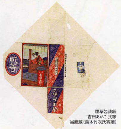
煙草包装紙 吉田あかこ氏等 当館蔵(鈴木竹次氏寄贈)