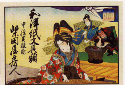
引札/明治34年/当館蔵(後藤謙治郎氏寄贈)